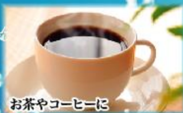
お茶やコーヒーに