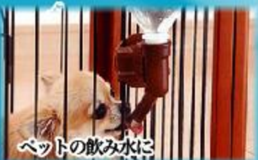
ペットの飲み水に