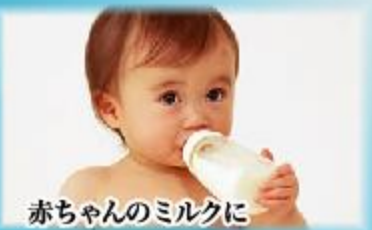
赤ちゃんのミルクに